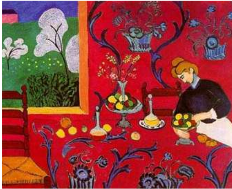
Henri Matisse, De gedekte tafel ( harmonie in rood ), 1908, Olieverf op doek, 180 x 220 cm, Sint-Petersburg